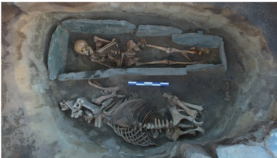
Рис. 4. Берел, объект № 113. Обустройство погребальной камеры. 4-сур. Берел, № 113 нысан. Қабір ішінің құрылысы. Fig. 4. Berel, site № 113. Arrangement of the burial chamber.