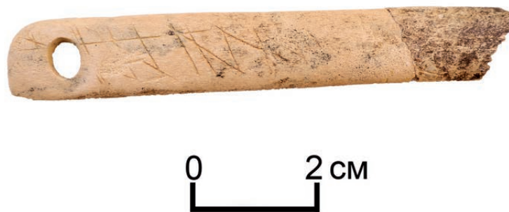
Рис. 5. Берел, объект № 113. Фрагмент роговой накладки с тамгообразными знаками.

Из вышеуказанного набора самыми интересными предметами являются две роговые накладки с тамгообразными знаками. Первый предмет – это фрагмент обработанного рога прямоугольной удлиненной формы, с тамгообразными насечками на лицевой стороне и овальным отверстием на целом конце (рис. 5). Размеры: длина 8,3 см, ширина 1,5 см, диаметр отверстия 0,6 см. Данное изделие авторами раскопок [Самашев, Кариев 2020: 926] идентифицировано в качестве накладки сложносоставного лука гуннского типа. Однако «нетрадиционная» форма и наличие отверстия заставляет нас сомневаться в этом.