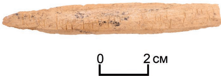
Рис. 7. Берел, объект № 113. Фрагмент срединной накладки на лук с «заметками».

В целом, в среде древних тюрков Алтая известны случаи прорисовки знаков отличия в виде тамг, либо рунического письма на срединных накладках на лук и накладках на колчан. Возможно, эти тамгообразные знаки на двух накладках также являются знаками отличия их владельца, либо каким-то заклиниванием, либо магическими символами. В любом случае