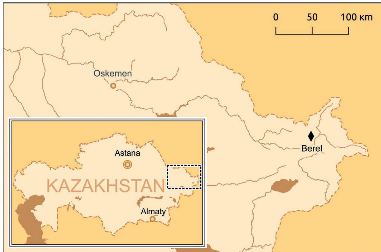
Рис. 1. Берел на карте Казахстана. Составитель: М.А. Антонов

Хунно-сяньбийские погребения некрополя Берел (рис. 1) весьма значимы в плане освещения историко-культурных событий малоизвестного периода между ранними и средневековыми кочевниками Казахского Алтая. Рассматриваемые в данной статье роговые предметы были найдены при вскрытии каменной конструкции объекта № 113 среди предметов, сопровождавших погребенного человека, и представляют собой уникальные образцы косторезного дела кочевников «переходного»