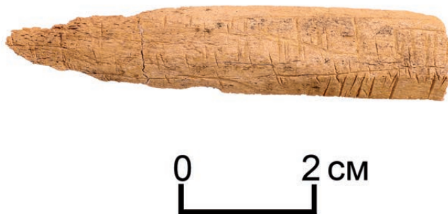
Рис. 6. Берел, объект № 113. Фрагмент срединной накладки на лук с тамгообразными знаками. 6-сур. Берел, № 113 нысан. Таңба тәріздес белгілері бар садақтың ортаңғы жапсырмасының сынығы. Fig. 6. Berel, site № 113. The fragment of a middle onlay on the bow with tamga-shaped signs.

Само изделие эксплуатировалось некоторое время, о чем свидетельствует изношенность вокруг отверстия, с помощью чего данная накладка подвешивалась/привязывалась или была пришита. «Традиционные» штрихообразные насечки на обратной стороне указывают на то, что накладка была приклеена к чему-либо или же подготовлена к приклейке. Однако, при визуальном и микроскопическом осмотре не удалось обнаружить остатки клея. Возможно, они были утрачены во время консервационных мероприятий. В научной литературе со ссылкой на китайские источники изложены факты использования рыбьего клея [Кубарев 2005: 83; Liu Mau-Tsai 1958: 136].