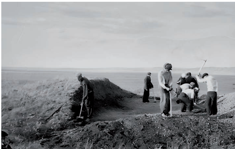
Рис. 2. Раскоп кургана у села Лосевка, 1956 г. 2-сур. Лосевка ауылындағы обаның қазбасы, 1956 ж. Fig. 2. Kurgan pit in the village of Losevka, 1956.