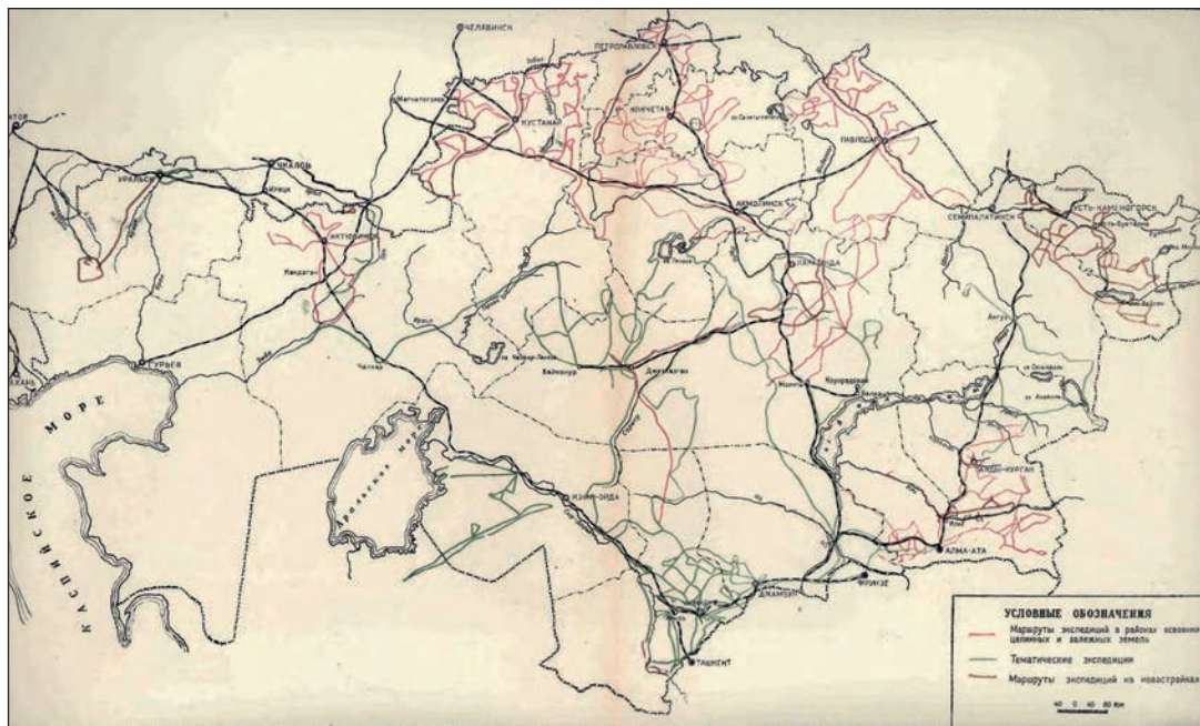
Рис. 1. Карта маршрутов археологических экспедиций (по: [АКК 1960. Приложение] 1-сур. Археологиялық экспедициялар маршруттарының картасы ([АКК 1960. Қосымша] бойынша) Fig. 1. Map of archaeological expedition routes, after – Archeologicheskaya karta Kazahstana. 1960. Prilozhenie

Разведочными маршрутами были пройдены берега рек Ишим, Чаглинка, их притоки, озёра. В основном осматривались территории крупных целинных районов – Есильский, Кийминский, Атбасарский, Макинский. Иногда разведочный отряд останавливался на 2–3 дня и проводил выборочные раскопки памятников для определения их хронологической позиции, как это было сделано на берегу озера Айдабуль, на притоке Ишима, р. Коныр. В научном архиве К.А. Акишева есть фотографии раскопок (рис. 2; 3).