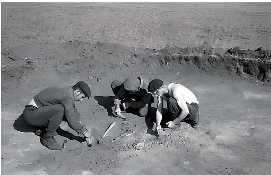
Рис. 3. Расчистка костяка в кургане могильника у села Октябрьское, 1956 г. 3-сур. Октябрьское ауылындағы қорым обасында сүйек қаңқасын тазарту, 1956 ж. Fig. 3. Clearing the skeleton in the kurgan of the burial mound near the village of Oktyabrskoye, 1956.