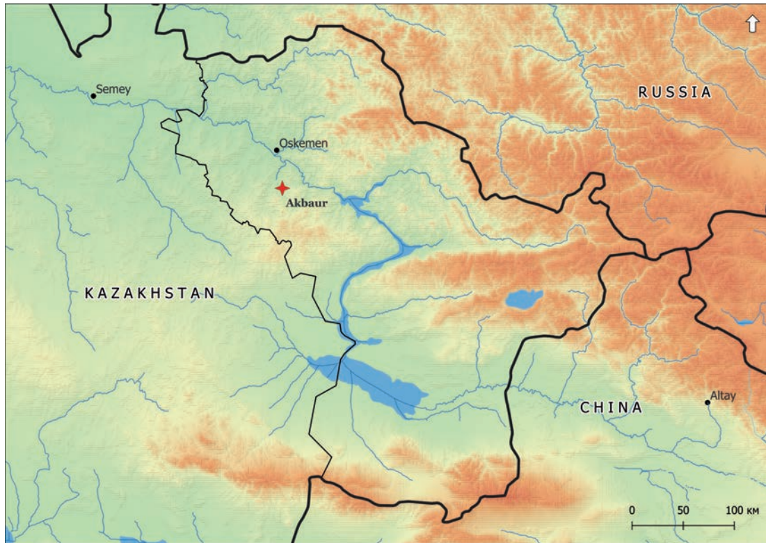
Рис. 1. Карта с указанием расположения грота Акбауыр 1-сур. Ақбауыр үңгірінің орналасуын көрсететін карта Fig. 1. Map showing the location of the Akbaur Grotto

Росписи грота Акбауыр, расположенного в Уланском районе Восточно-Казахстанской области (рис. 1)*, широко известны мировой науке [Самашев 2025; Rozwadowski, Lymer 2012].