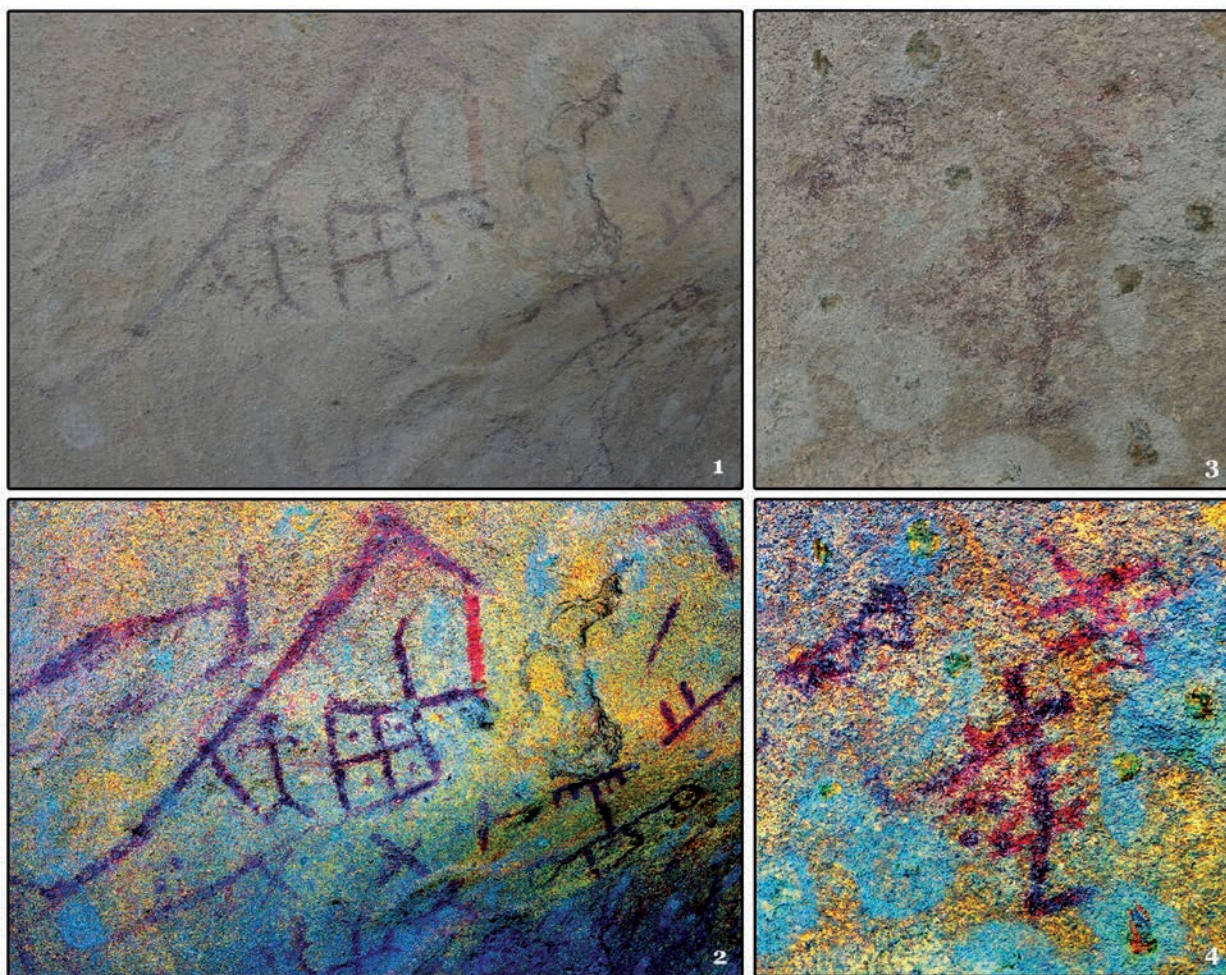
Рис. 3. Грот Акбауыр. Фрагменты композиции с бордовыми и оранжевыми пигментами: 1, 3 – оригинальные фотографии; 2, 4 – обработка плагином DStretch в режиме LDS (параметр растяжения 20)

3-сур. Ақбауыр үңгірі. «Қою қызыл» және «қызғылт сары» пигменттері бар композиция фрагменттері: 1, 3 – түпнұсқа фотосуреттер; 2, 4 – DStretch плагиіні арқылы LDS режимінде өңдеу (созу параметрі 20)