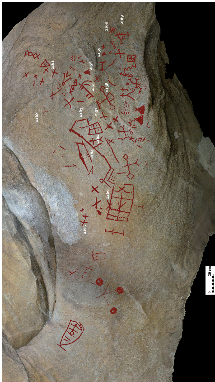
Рис. 2. Грот Акбауыр. Цифровая аналитическая прорисовка на основе ортофото и сопоставления различных режимов DStretch с указанием точек pXRF-анализа 2-сур. Ақбауыр үңгірі. Ортофото негізінде жасалған цифрлық аналитикалық сызба және pXRF талдау нүктелері көрсетілген DStretch бағдарламасының әртүрлі режимдерін салыстыру Fig. 2. Akbaaur Grotto. Digital analytical tracing based on an orthophoto and comparison of different DStretch enhancement modes with indicated pXRF analysis points