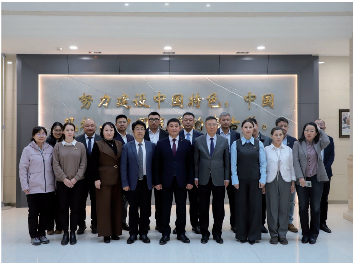
5-сур. Ә.Х. Марғұлан атындағы Археология институты делегациясының Қытайға сапары. 2025 жыл 10–20 қараша.

Рис. 5. Визит делегации Института археологии имени А.Х. Маргулана в Китай. 10–20 ноября 2025 г.