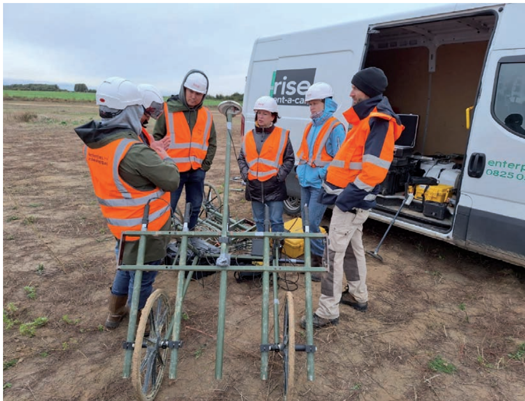
3-сур. Қазақстан делегациясының INRAP-қа сапары. 2025 жыл 21–26 қыркүйек.

The map numbers indicate: 1 – Ugam site; 2 – Altyn Kolat locality; 3 – Birlik 1 burial ground; 4 – Sharyn settlement; 5 – Saryzhazyk 3 site; 6 – Khan Ordasy settlement; 7 – Bakatas settlement; 8 – Sandyktau settlement; 9 – Aibas Darasy kurgan; 10 – Zhuldyz 1 burial ground; 11 – Kokentau settlement; 12 – Kyzylbulak 4 settlement; 13 – Turgen 2 settlement; 14 – Karkara burial ground; 15 – Serektas settlement; 16 – Saryzhazyk complex; 17 – Besmoinak kurgans; 18 – Zhankent settlement; 19 – Syutkent settlement; 20 – Kyryk Oba burial ground; 21 – Sorlakmola 2 burial ground; 22 – Babish-mola settlement; 23 – Kara Asar settlement; 24 – Kansar necropolis; 25 – Zhaylautobe complex; 26 – Karakabak settlement; 27 – Krasnyi Yar settlement; 28 – Karabau burial ground; 29 – Taulytas burial ground; 30 – Tazhegul burial ground; 31 – Karatogan complex; 32 – Ormanbet settlement; 33 – Zhetizhar settlement; 34 – Akmaya settlement; 35 – Egindi site; 36 – Eshkiolmes petroglyphs; 37 – Ush kyz complex; 38 – Abat-Baitak necropolis; 39 – Zhabai burial ground; 40 – Atshubar settlement; 41 – Edige complex; 42 – Aktobe burial ground; 43 – Rudnichnyi burial ground; 44 – Kainar 1 site; 45 – Kainar 3 site; 46 – Mastekbai site; 47 – Borsyk burial ground; 48 – Muzdybai 3 burial ground; 49 – Zhabai burial ground; 50 – Atshubar burial ground; 51 – Zhamanty locality; 52 – Uzynagash 1 site; 53 – Uzynagash 3 site; 54 – Baganaly burial ground. Prepared by K.M. Asylbekov