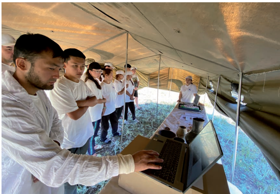
6-сур. «Археологиядағы пәнаралық әдістер» халықаралық жазғы археологиялық мектебі. Ұлытау, 2025 жыл 2–7 шілде.